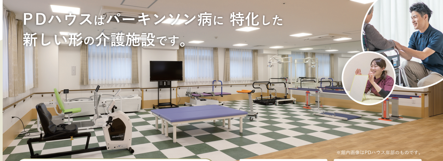
※館内画像はPDハウス岸部のものです。