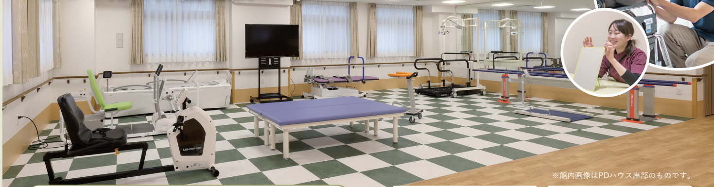
※館内画像はPDハウス岸部のものです。