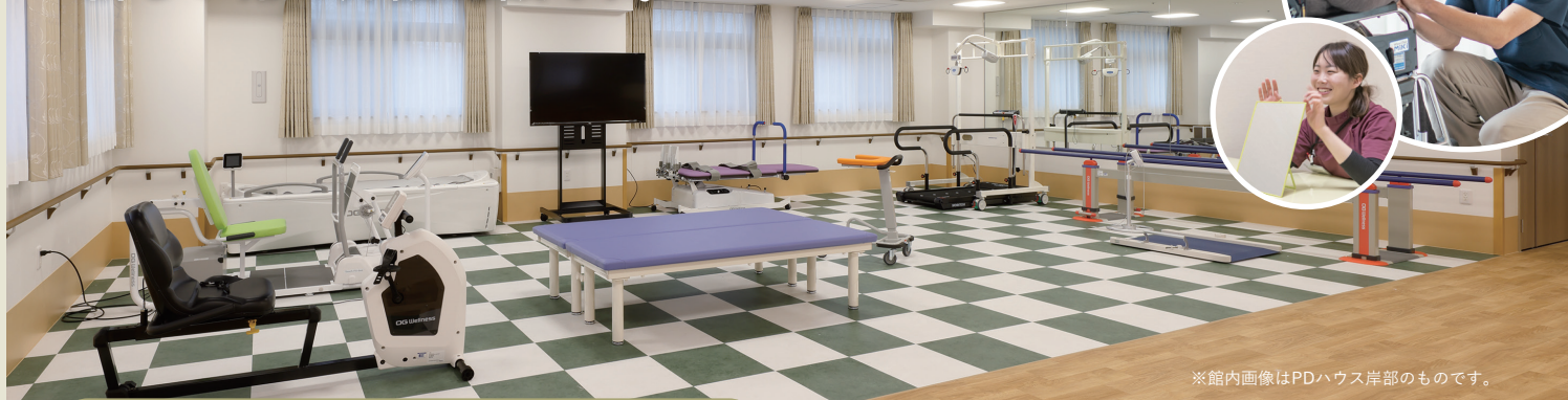
※館内画像はPDハウス岸部のものです。