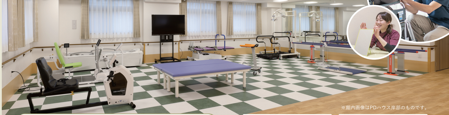
※館内画像はPDハウス岸部のものです。