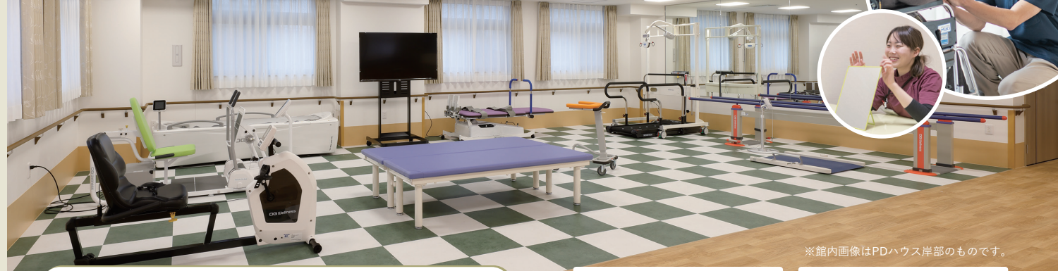
※館内画像はPDハウス岸部のものです。